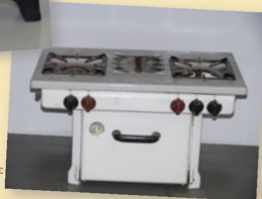
Petite cuisinière / four à gaz