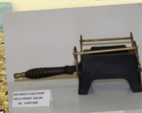
Chaufferette pour fers à friser