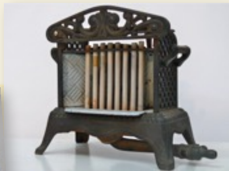
Radiateur à gaz

Ci-dessous, quelques appareils de la collection MEGE