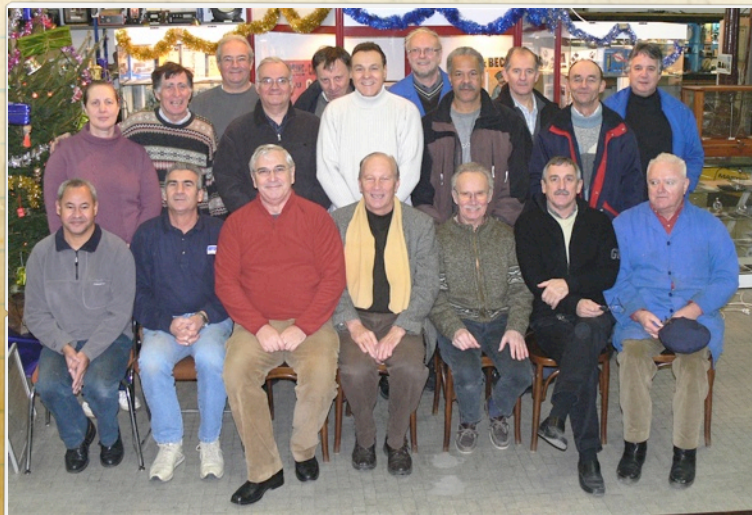
Une brochette des "actifs" sur le site de St Ouen qui vous présentent leurs vœux pour 2009