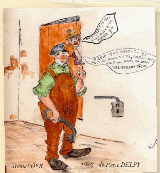
Manuel OFR - 1963