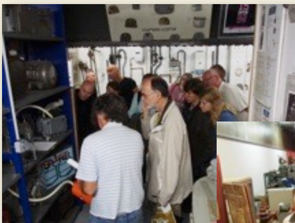
Quelques photos des visites des Journées du Patrimoine

MEGE a ouvert ses portes au public les 14 et 15 septembre. Les 4 visites guidées ont permis d'accueillir 84 personnes, qui ont fait part de leur satisfaction sur notre livre d'or.