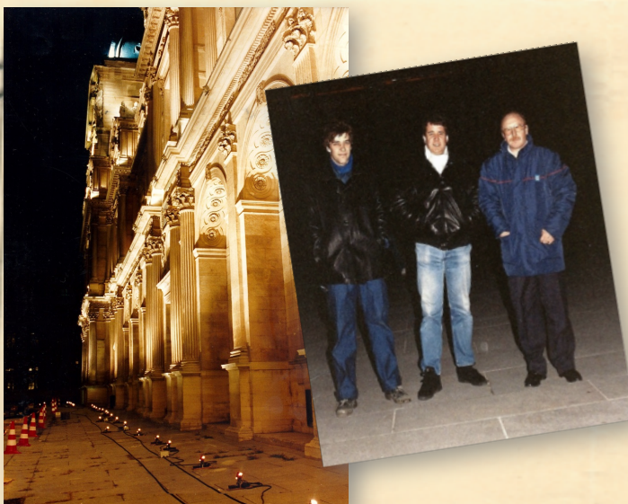
1er essai avec des spots équipés de lampes halogène 50W