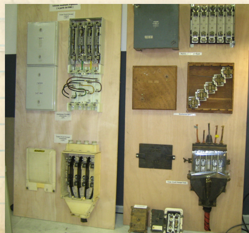
Panneaux colonnes montantes

Durant trois jours nous avons exposé des matériels des réseaux électriques et de sécurité. Des membres de l'association ont accueillis les groupes de visiteurs (agents, élus et riverains), à qui nous avons également présenté un diaporama sur l'histoire de l'électricité à Paris.